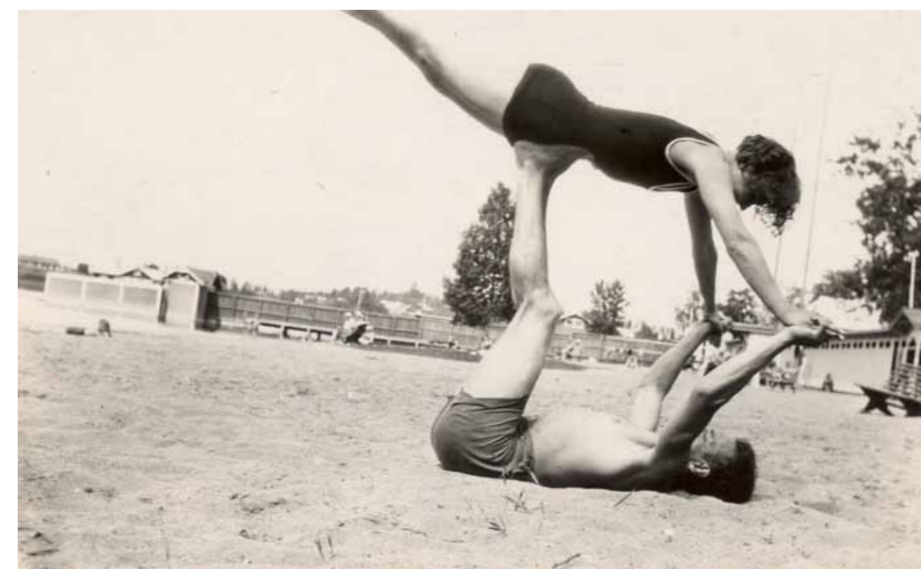
Kesäkiertueella 1930 ehdittiin uimarannallekin.