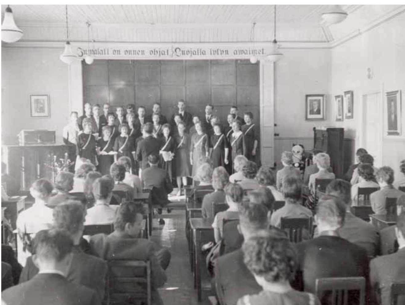
HOL piti 30-vuotiskiertueellaan 1959 koululaiskonsertin Mäntässä.