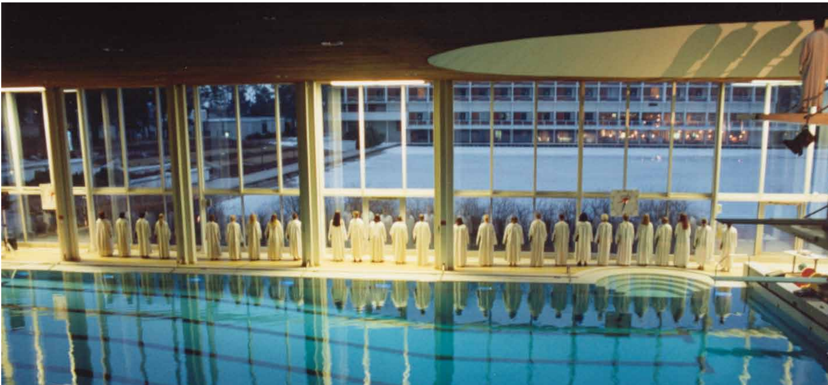
Kevätalvella 1998 taitavasti valaistussa Tapiolan uimahallissa pidetty Välimeri-konsertti oli myös visuaalinen elämys.