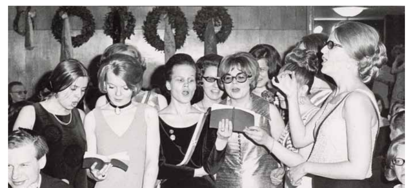
HOLlin miehet ja naiset esittävät serenadeja kuoron 40-vuotisjuhlassa 1969.