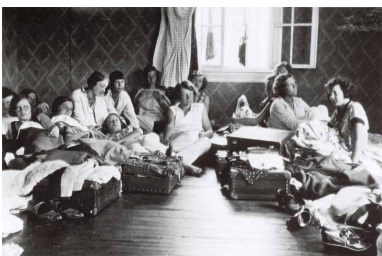
Kuoromatkoilla syntyy muistoja: HOLin tyttöjen huone maatalon yläkerrassa kesäkiertueella 1932.