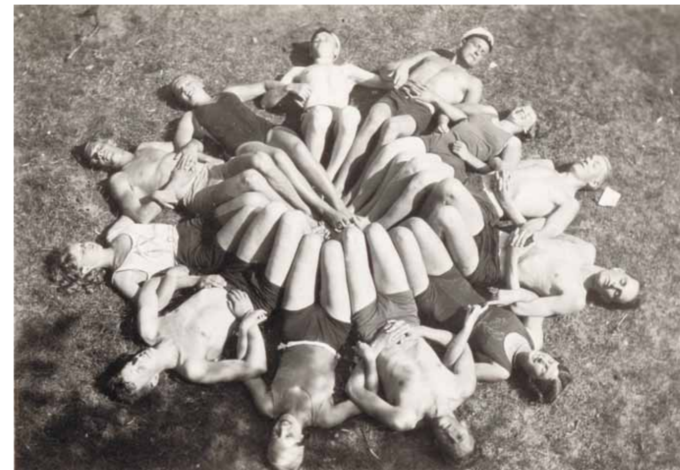
HOL nauttii auringonpaisteesta ensimmäisellä kesäkiertueellaan vuonna 1930.

HOL jatkoi kansallisromanttisella linjalla ja esiintyi edelleen lähinnä Hämeessä, jossa tehtiin laajoja kiertueita. Akateemisen kuorotoiminnan luonne oli kuitenkin muuttumassa, koska ylioppilaiden kulttuuriharrastukset nähtiin nyt tärkeänä kansanvalistuksena – ja pohjimmiltaan kommunismin torjuntana. Ylioppilaskuoroille alettiin järjestää vuotuisia kilpailuja, joissa iloista amatööriyttä, kuoron matalaa kynnystä ja toiminnan seurallista puolta vaalinut HOL ei menestynyt.