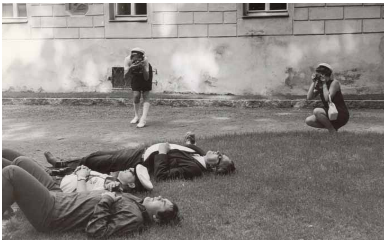
Ulkomaankiertueilla ehdittiin rentoutuakin: lepopetki Welsissä Itävallassa 1969.