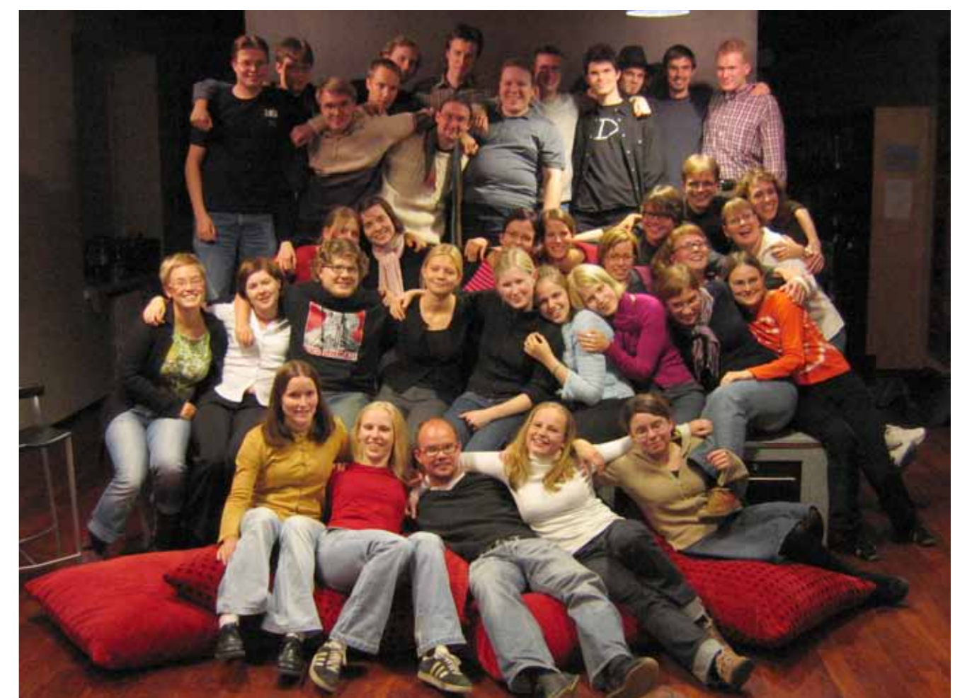
Kuoro on tiivis ja lämmin yhteisö. HOL yhdessä läjässä syksyllä 2004.

Laajemmin Hämmäläis-Osakunnan Laulajien vaiheista kertoo kuoron 75-vuotishistoriateos Osakunnan hauskin joukko – Hämmäläis-Osakunnan Laulajat 1929–2004.