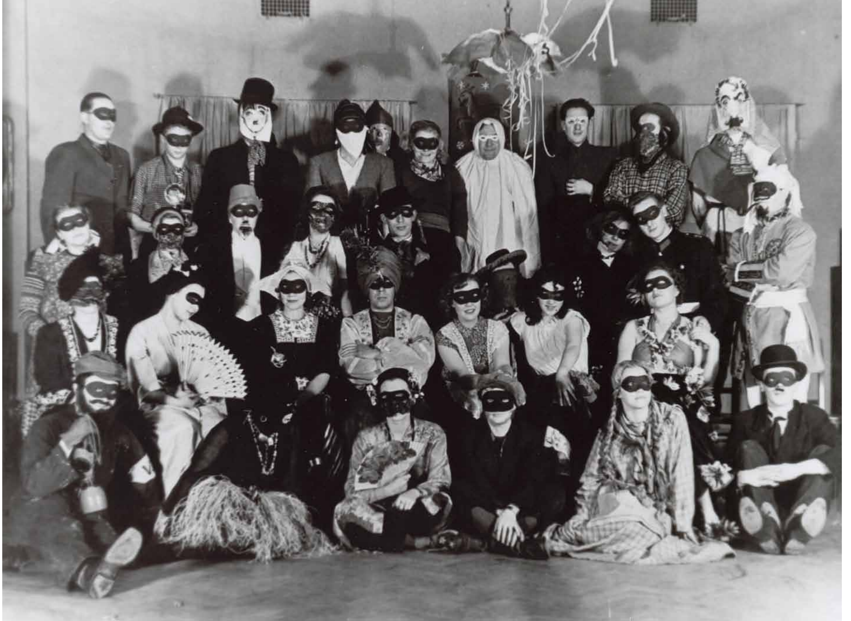
Monimuotoinen hauskanpito on aina kuulunut HOLlin perinteisiin. Vuonna 1950 HOL piti maskiaiset, joita muisteltiin vuosia.