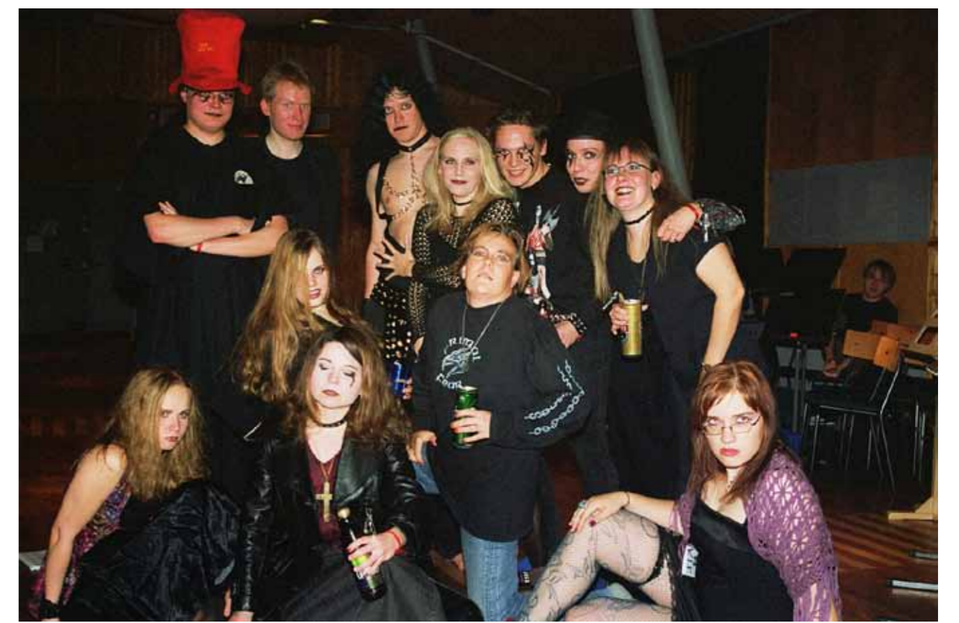
Teemabileet ovat tehneet kuoroileireistä entistäkin hausken. Hevileirillä oltiin syksyllä 2004.