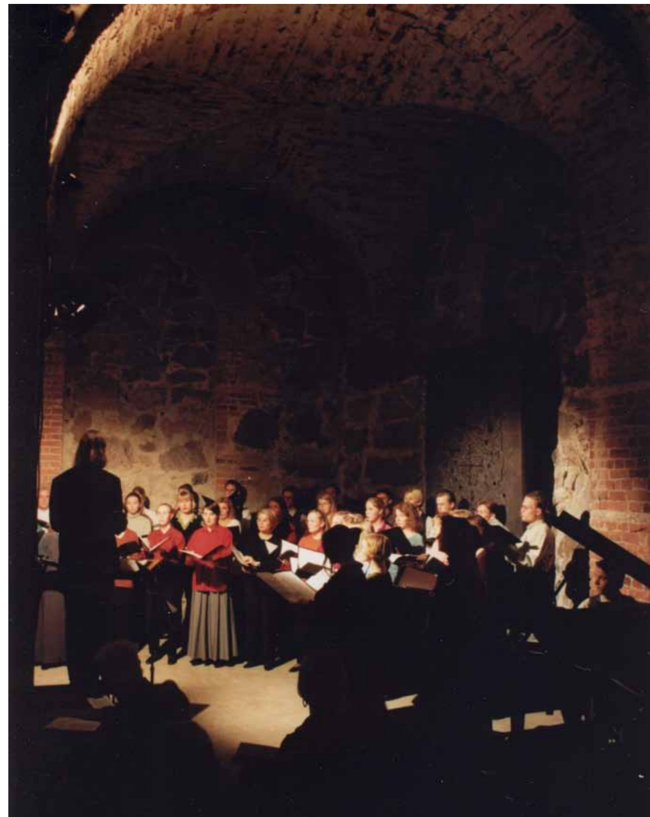
Valo loi vahvan tunnelman Sumujen saaret -konserttiin 1996.