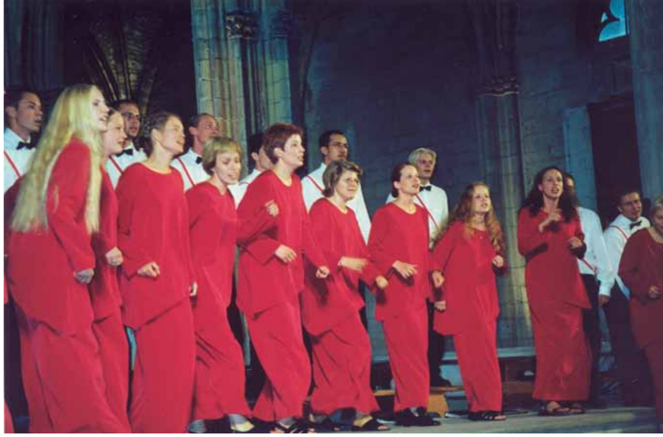
HOL hurmasi afrotanssilla ja naisten punaisilla kuoropuvuilla Europa Cantat -festivaalilla Neversissä Ranskassa vuonna 2000.