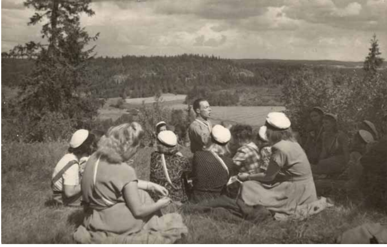
HOL Suomi-filmien tunnelmissa Hakoisten linnavuorella osakunnan kesäjuhilla Janakkalassa 1951.