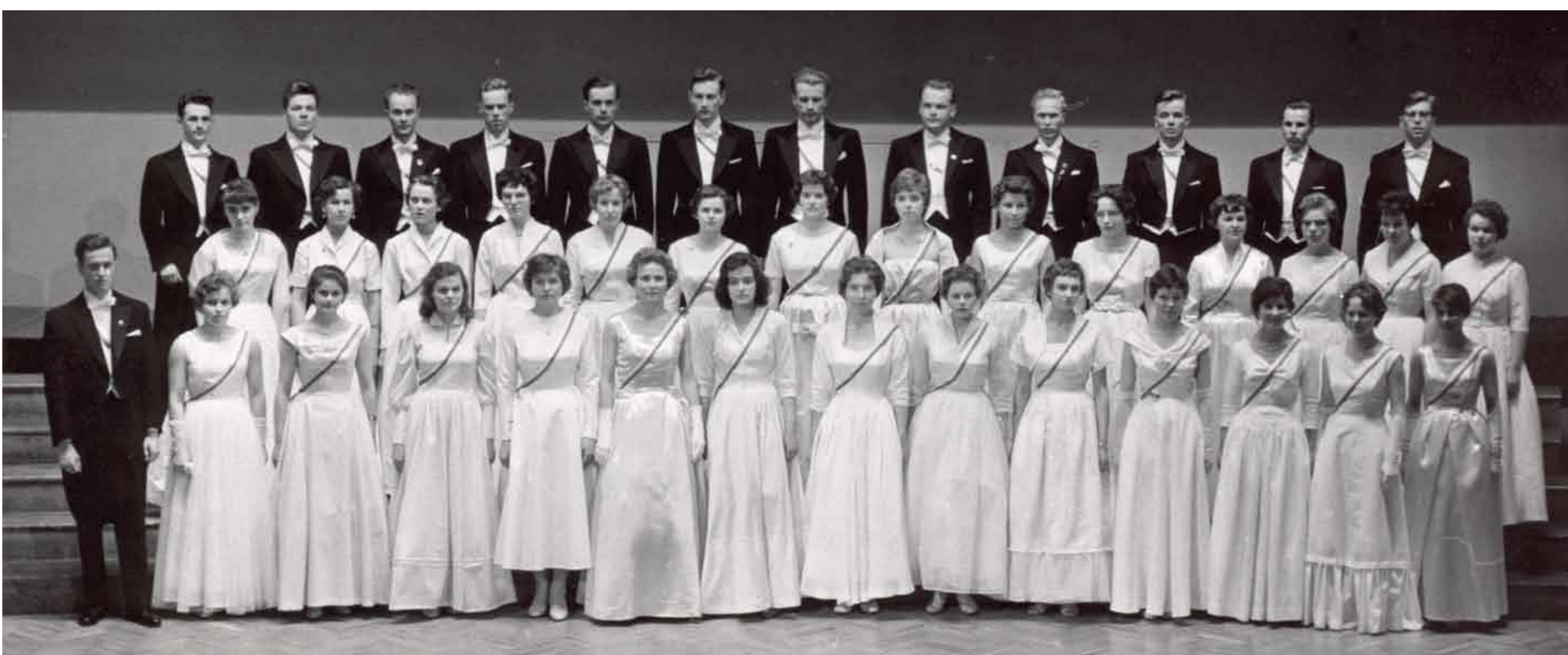
HOL 30-vuotisjuhlakonsertissaan 1959. Perusteellisen neuvottelun jälkeen naiset olivat päätyneet pitkään kokovalkoiseen asuun.