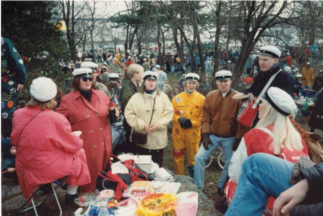
HOL on aina viettänyt vappua yhdessä. Piknik Ullanlinnamäellä vakiopaikassa vakiintui tavaksi 1980-luvulla. Tässä herkutellaan koleana vappuna 1995.