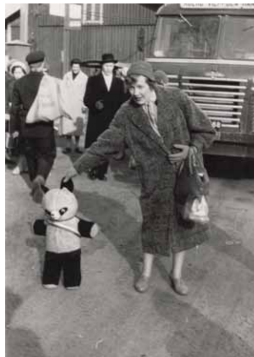
HOLlin maskotti Anselmi kiertueella 1959.