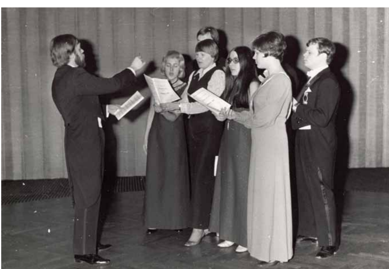
HOLin yhtye esiintyy tyylikkäästi frakeissa ja iltapuvuissa Pykälä ry:n vuosijuhlassa 1970.