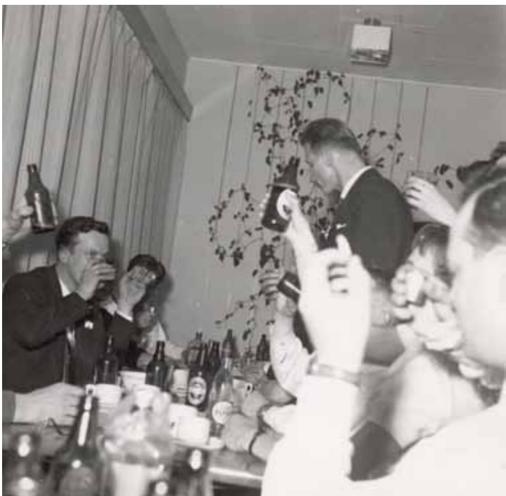
Olut maistui hyvin HOLlin miehille 1959, naisille varsin huonosti vielä tähän aikaan.