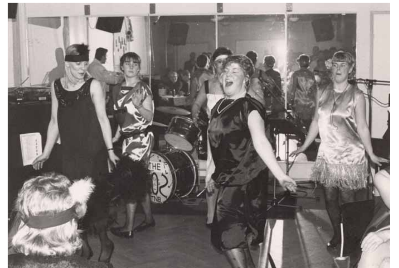
Cotton Club -teemabileet 1988 nostivat kuorolaisten monet kyvyt esiin.